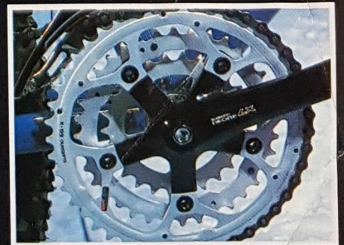
Shimano Deore LX Low Profile-Kurbeln Shimano Deore LX Top Pull-Umwerfer

Rahmen: Tange MTB CroMo Top Tube Cable Routing, komplette Shimano Deore LX Ausstattung (auch Pedale) Reifen: Ritchey Megabite Z-Max Felgen: Araya CV-7, grau anodisiert. Erhältlich auch in Black