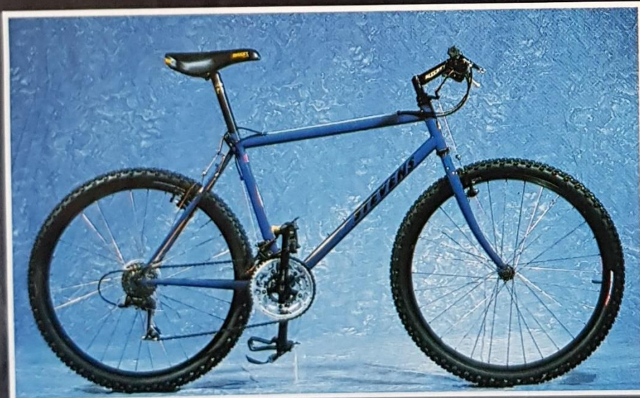
511 Night Blue

Rahmen: Tange CroMo Double Butted, komplette Shimano Altus A 10-Gruppe mit Low Profile Kurbelsatz und STI Reifen: Ritchey Blackwall Felgen: Araya CV-7, grau anodisiert. Erhältlich auch in Gelb