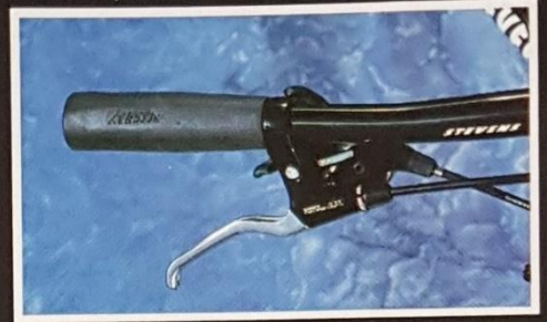
Shimano Altus A10 Rapidfire Plus-Schalthebel