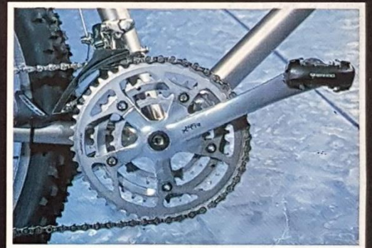
Shimano XTR-Tretlager Shimano XT SPD-Pedale