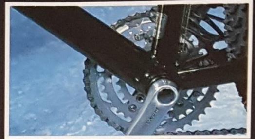
Oversize – Alu 7005-Rahmen Superglide 730-A Kettenblätter