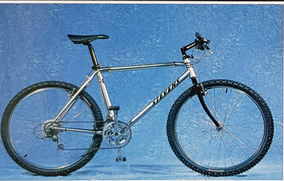
Ti XTR Limited Edition

Rahmen: 7005 Heat Treated Aluminium, Shimano Deore XT Ausstattung Felgen: Ritchey Vantage Comp Reifen: Ritchey Z-Max 2.1 Sattel: Stevens Titanium